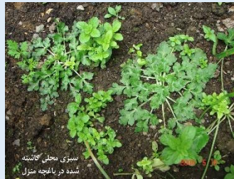
سبزی محلی کاشته شده در باغچه منزل

در صورتی که تمایل به خوردن خالیواش، نعنا و سبزیجات محلی به صورت خام داشته باشیم، ابتدا آنها را با آب و مایع شوینده به خوبی شسته و به مدت ۱۵ دقیقه در محلول سرکه سفید (یک لیوان سرکه در ۴ لیوان آب) قرار می دهیم. سپس سبزی را از محلول سرکه خارج کرده، به خوبی شسته و مصرف می کنیم. چوچاق را نیز با همین روش میتوان ضد عفونی و مصرف کرد ولی فریز کردن چوچاق مولینکس شده با اطمینان بیشتری انگل را از بین می برد. در موقع پاک کردن سبزیجات از دستکش استفاده شود و در موقع تمیز کردن سبزی از بردن دست به دهان خودداری گردد. با توجه به این که متاسرکر فاسیولا گاهی به صورت معلق در آب تشکیل می شود از نوشیدن آبهای سطحی و چشمه های رو باز نواحی ییلاقی پرهیز شود. جوشاندن و مصرف آن مشکلی ایجاد نمی کند. برای ضد عفونی کردن توت فرنگی ابتدا آن را به خوبی با آب شسته و سپس به مدت ۳-۵ ثانیه در ظرف آب جوش وارد می کنیم و در ادامه آن را سریعاً از آب جوش خارج کرده و در آب سرد قرار می دهیم. در صورتی که کیفیت توت فرنگی خوب باشد این فرایند تأثیر زیادی بر تازگی آن نخواهد داشت. بهتر است توت فرنگی به مقداری ضد عفونی شود که در یک وعده به مصرف برسد.