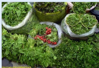
فروش سبزیجات محلی در بازارهای گیلان

برای برقراری چرخه زندگی انگلهای فاسیولا وجود دامهای آلوده، منابع آبی دائمی یا فصلی، بارندگی فراوان و حلزون های میزبان واسط ضروری می باشند. حیوانات آلوده به فاسیولا، تخم انگل را همراه با مدفوع خود به محیط خارج دفع می کنند. در صورتی که این تخم در آب قرار گیرد در درجه حرارت مناسب پس از حدود ۳ هفته در داخل آن یک لارو مژه دار به نام میراسیدیوم به وجود می آید. این لارو پس از تشکیل از تخم خارج شده و با نفوذ در بدن حلزون های آبزی جنس لیمنه شروع به رشد و تکثیر می کند. در نتیجه تکثیر میراسیدیوم در بدن حلزون تعداد زیادی لارو دم دار به نام سرکر ایجاد می شود. سرکر ها پس از کامل شدن از بدن حلزون میزبان واسط خارج شده و در آب رها می شوند. این لاروها غالباً با بادکنک های خود به برگ گیاهان آبزی می چسبند و با ترشح یک دیواره محکم در اطراف سر خود به یک فرم مقاوم به نام متاسرکر تبدیل می شوند. سرکرها گاهی به صورت معلق در آب نیز به متاسرکر تبدیل می شوند. حیوانات نشخوارکننده و انسان به دنبال خوردن گیاهان و یا سبزیجات آبزی حامل متاسرکر و یا آب های سطحی آلوده، به فاسیولیزیس مبتلا می شوند.